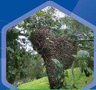
Colonia en proceso de evasión (migración)

Para suplementar proteínas y grasas se emplean preparaciones denominadas generalmente tortas proteicas, las cuales se elaboran principalmente con polen, miel, levadura de cerveza, harinas micronizadas de soya, trigo, maíz, entre otros.