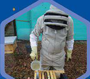
Alimentador interno para jarabe

Para suplementar proteínas y grasas se emplean preparaciones denominadas generalmente tortas proteicas, las cuales se elaboran principalmente con polen, miel, levadura de cerveza, harinas micronizadas de soya, trigo, maíz, entre otros.