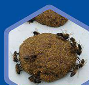
Abejas consumiendo torta protéica