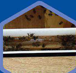
Abejas bebiendo en alimentador interno

Es muy importante que el apicultor implemente buenas prácticas a la hora de elaborar y suministrar los alimentos para las abejas, realizando el procedimiento en un lugar adecuado, utilizando recipientes limpios y materias primas de calidad y en buen estado, y alimentadores que eviten derrames y pillaje entre colmenas.