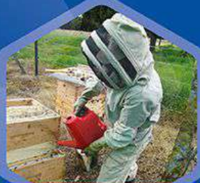
Alimentador externo para jarabe

En los sistemas de producción apícola, es necesario garantizar la disponibilidad de nutrientes para las abejas, ya sea de forma natural (floración) o artificial (alimentación), de lo contrario las colmenas se debilitan, su sistema inmune falla, no producen bien e incluso pueden evadirse (migrar) buscando un mejor lugar para nidificar.